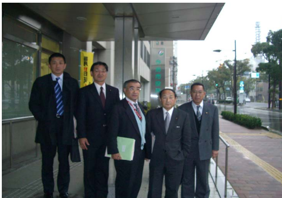
(1月28日(月) 今治市役所前で5人のメンバーと共に)