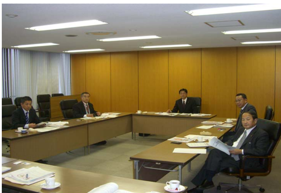
(今治市役所での研修)